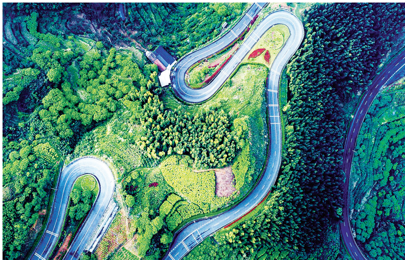
通村公路，带领人们发现美景，也让自己成为风景。

“四好农村路”修的是路，改变的是农村面貌，联系的是民心。余姚将以打造“四好农村路”建设示范县为契机，统筹兼顾、科学规划、长效管理，把农村公路建设与