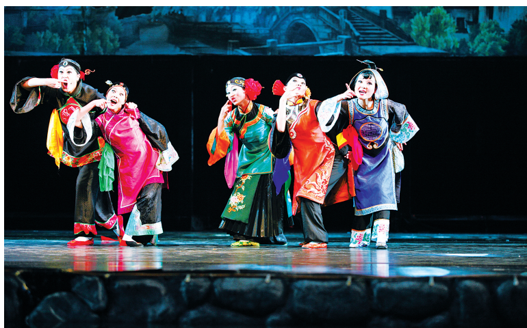
《十里红妆·女儿梦》剧照。