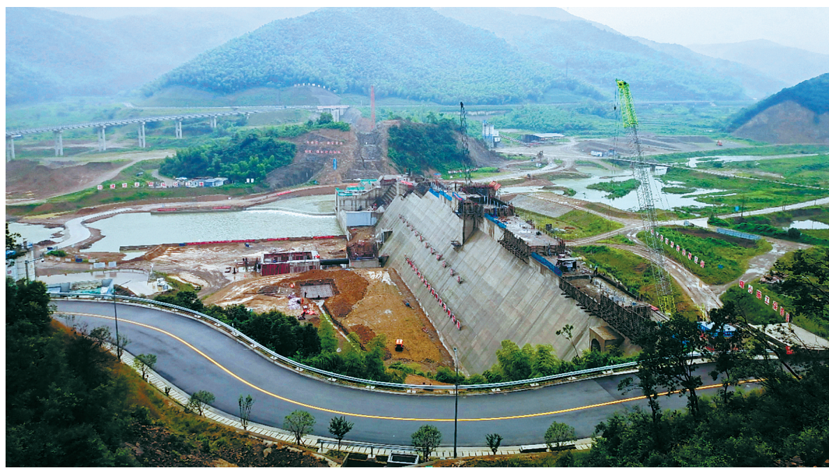
葛岙水库大坝浇筑预计年底完成。