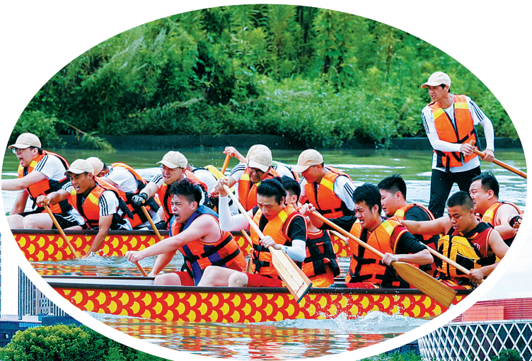
龙舟赛现场。

本报讯(记者沈孙晖 通讯员孙丹静 镇海区委报道组房晓曦)百舸争流,水花四溅。昨天上午,镇海区庆祝建党百年“同心同行”龙舟赛在箭港湖拉开战幕。这是镇海区首次举行龙舟赛,参赛的12支队伍均来自该区的企业。