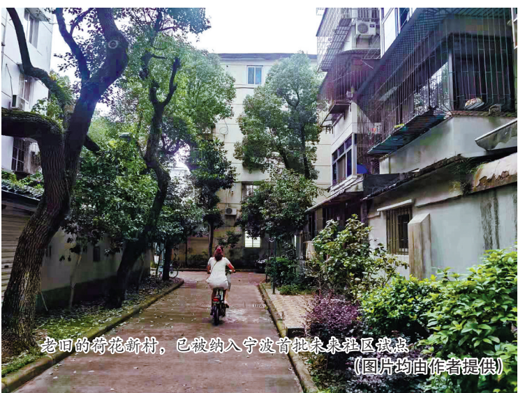
老回的荷花新村，已被纳入宁波育批未来社区建设 (图片均由作者提供)

我国南北各地都适合种植荷花。宁波地属水乡，荷花种植尤为普遍。不论是城里的公园，还是乡村的塘边，都能见到大片大片的荷花。在地名中，也出现了许多葳蕤生香的“荷花”。 鄞州云龙有荷花桥，村民姓王，唐时从山西太原迁甲村后发族另建成村。因村边有桥，桥下荷花盛开，故以桥名称为荷花桥。子孙繁衍后再建新村，根据方位称新村为上荷花村，老村为下荷花村。现荷花桥村域更大，除原来的上、下荷花桥，还包括童家漕、杜村。 鄞州划船社区有荷花庄，原为宁波东郊乡间村落，以村中荷