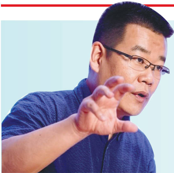
徐则臣在作主题讲座。