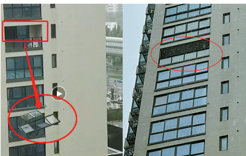
左图：富力悦士庭9幢一住户阳台的窗户被大风刮走。（视频截图） 右图：记者到达现场时，窗户已不见。

在北岸琴森社区，记者了解到，楼顶太阳能热水器于7月25日清晨5点左右坠落，并被物业发现。相关工作人员第一时间清理了现场。事件发生后，社区及物业曾考虑对楼顶所有太阳能热水器进行排查，但由于天气恶劣无法实施。