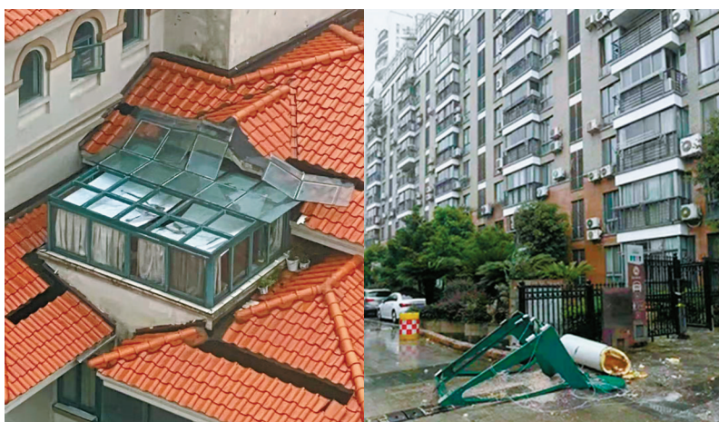
左图：青林湾东区77幢二单元楼顶一阳光房的玻璃顶棚有一半被狂风掀起。 右图：北岸琴森楼顶坠落的太阳能热水器。