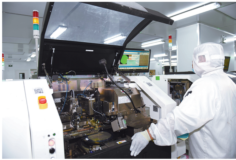
群芯微电子核心MCU芯片的月产能已超过300万颗。

再以手机为例，人脸识别、移动支付、物体建模等涉及红外TOF技术（飞行时间技术）的功能，都要以光电产品为媒。时下热门的手机大功率充电技术也需要大量运用长爬距光耦。目前，群芯微电子所生产的长爬距光耦产品，已逐步与国内大牌手机制造商开展合作。