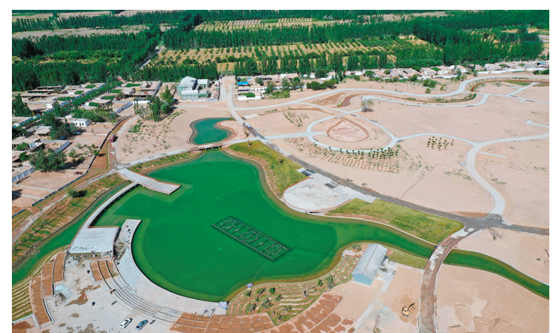
建设中的甬库振兴村。

此外,宁波援疆指挥部还携手中国科学院沈阳所、宁波农科院和新疆农科院等多家单位,创建“库车市现代农业科创中心”,建立8个实验室、3个专家工作站,引入掌握果、龟兹种业、驭云航空、颐康生物等一批优质合作企业,努力做到制种育苗、成果转化、应用推广、培训培育等市场化自主运行,有效推动库车农业产业化、现代化发展,为乡村振兴提供科技支撑。(本系列完)