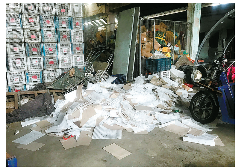
姚北小商品市场一角。