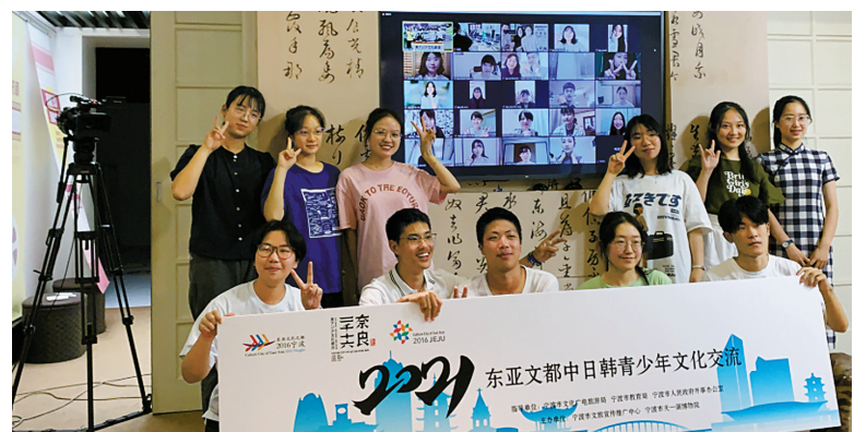
2021东亚文都中日韩青少年文化交流活动开幕。

采用线上线下相结合的方式开展,共同学习探讨音乐创作与书法艺术。 来自效实中学、宁波市第二中学、镇海中学、宁波大学、宁波诺丁汉大学、宁波工程学院等12名学子通过线上报名参加了昨日举行的首场线上交流活动。据了解,本次活动将持续至11月中下旬。其间,将举行4场集中线上交流和2场小组自主线上交流活动,并在网络平台公开展示音乐作品、书法作品等活动成果。