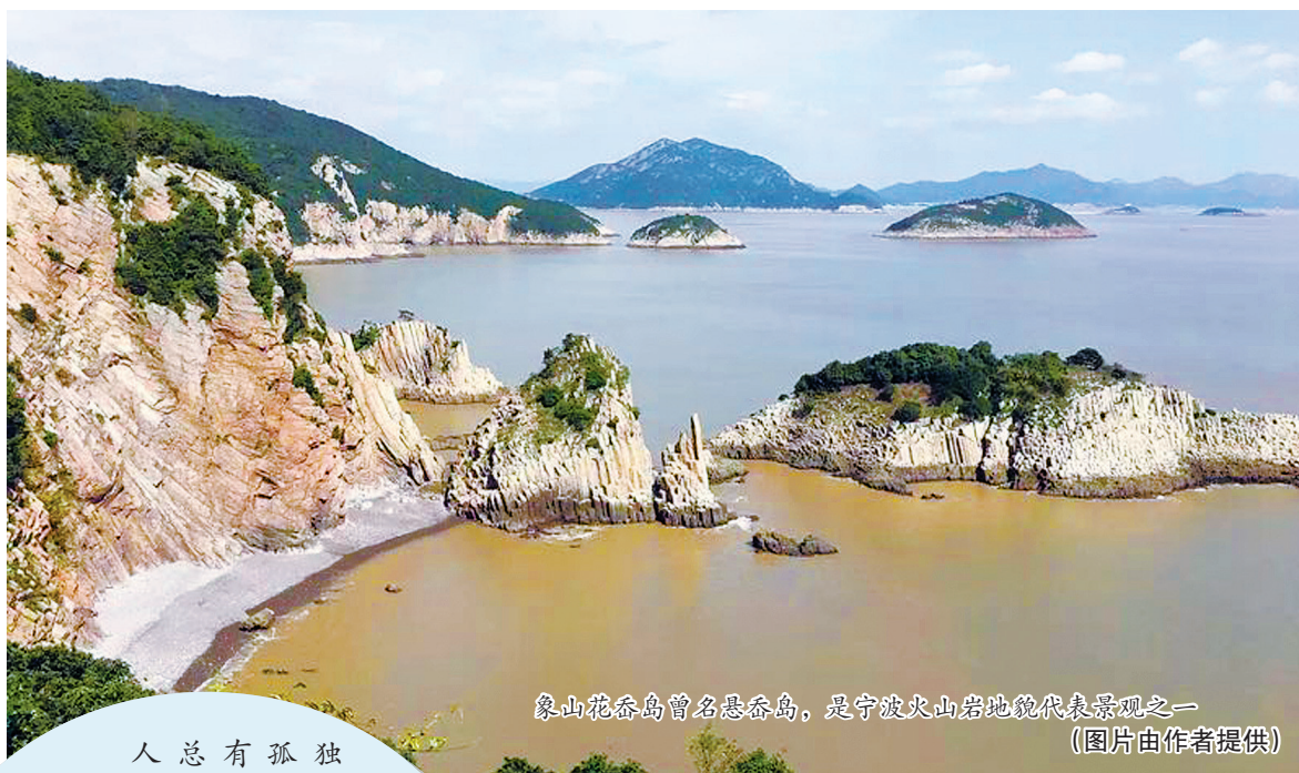
象山花吞岛曾名悬奈岛，是宁波火山岩地貌代表景观之一

人总有孤独时，孤独是个充满哲思的命题，不同人对此有不同感悟和解答。有趣的是，宁波地名中，也能看见“孤独”的影子，它们可能是一座独坐田畴的山丘，可能是一个孤凸海面的岛礁，还可能是一条冷僻寂静的山岭。和很多孤独的人一样，它们在自己的世界里，云水禅心，淡看红尘。