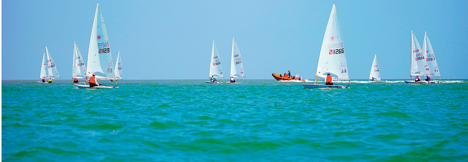
昨天,全运会帆船比赛(宁波赛区)正式开赛。