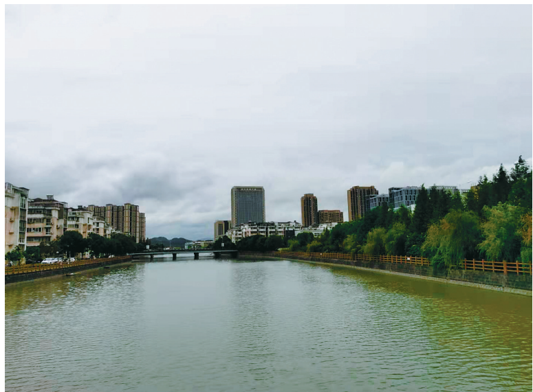
油车头位于今梅沁社区居委会附近

江北慈城有莫家王油车，清光绪《慈谿县志》作黄油车。村处山麓与溪流之间，莫、王两姓主居此。王姓祖上曾在此开榨油坊，故称莫家王油车。上世纪50年代，石碾、石磨等油坊遗物尚存。