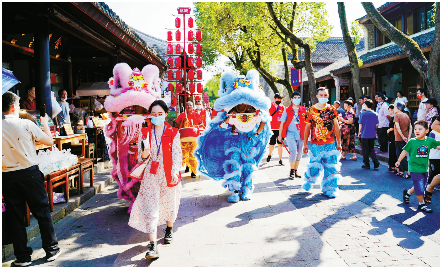
舞狮民俗巡游现场,从县衙到民权路步行街,一路锣鼓喧天,热闹非凡。

本报讯(记者廖惠兰 通讯员卓璇)昨天,为期7天的非遗民俗文化节在慈城古县城热闹开幕。活动现场,舞龙舞狮穿梭“祥云”,弄潮千年;民俗彩灯点亮街头巷尾,韵味十足;汉服女神起舞翩跹,衣袂翩翩……千年国风与现代潮流在这里碰撞。