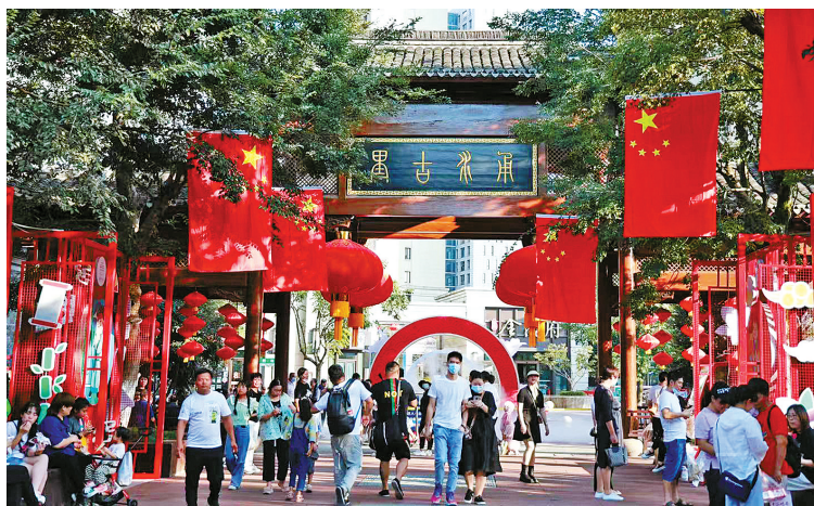
南塘老街内,最耀眼的是“中国红”。

这个假期,南塘老街还将吃喝玩乐一键配齐。新开业的素食餐厅、广式打边炉、非遗铜文化……市民总能在街上找到阖家聚餐、朋友约饭、购物消费的“心头好”。