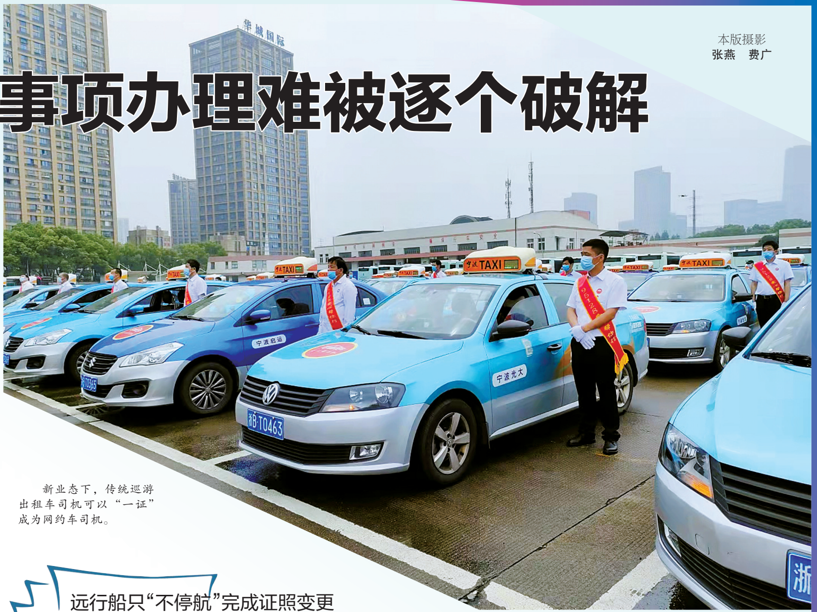
新业态下，传统巡游出租车司机可以“一证”成为网约车司机。

目前，在宁波从业的货运司机超过10万名，其中数万人的从业资格证在外地，以后，这数万名货运司机不必再为了证书的年审事宜来回奔波了。有数据显示，我国道路货运从业人员约2100万人，因此，这项源于宁波、涉及全国的“联网”和“触网”改革，将惠及2000多万人的庞大群体。