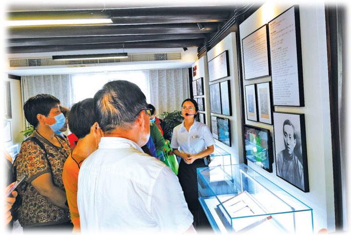
▲今年的爱心旅游直通车活动也是一次“初心之旅”。 ▶宁波爱心旅游直通车开进前童古镇。