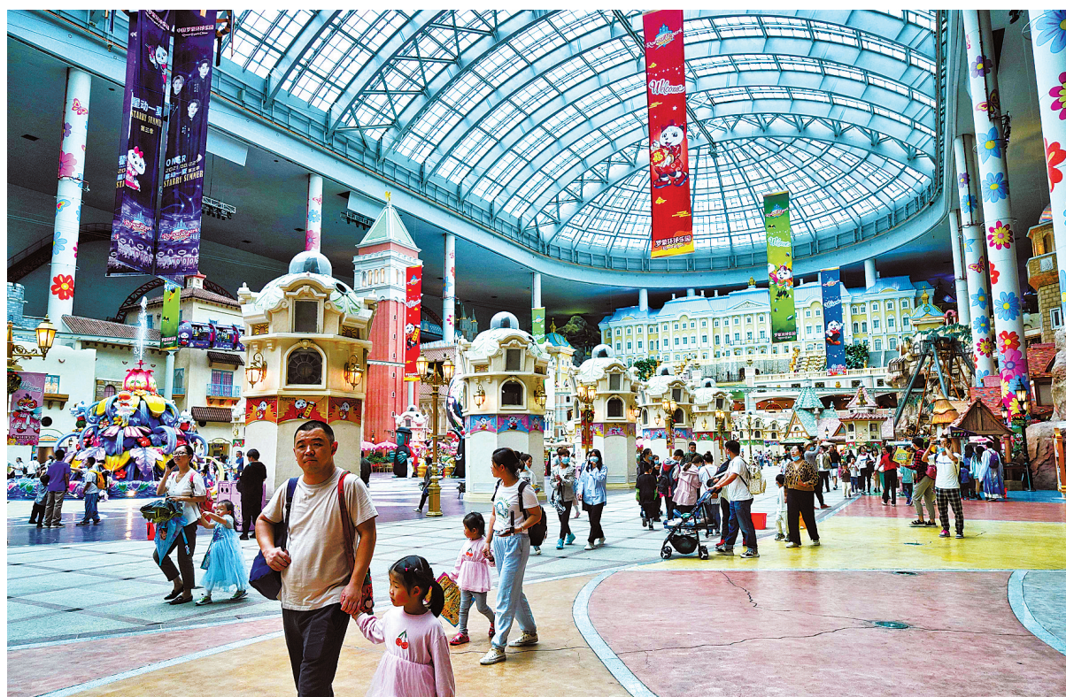
昨天，罗蒙环球乐园迎来众多亲子游团队。

昨天是一年一度的“市民旅游日”，虽然下雨降温，但在大力度惠民措施下，全市各大景区景点和文化场所还是迎来了热情高涨的市民。据统计，截至10月16日16时，全市62家景区(点)共接待游客6.5万人次，累计优惠额度370.88万元。