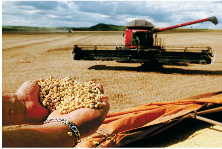
2021年2月4日，农户在巴西首都巴西利亚郊区展示收割好的大豆。得益于大豆、铁矿砂等初级产品对华出口的良好表现，2020年巴西出口展现较强韧性。

如今，尽管疫情仍在多国多地肆虐，第四届进博会将以线上线下相结合的方式如期开幕。数据显示，共有来自127个国家和地区的近3000家参展商亮相企业展，反映出人们对经济全球化大势的认同，再次彰显中国市场的“全球磁力”。