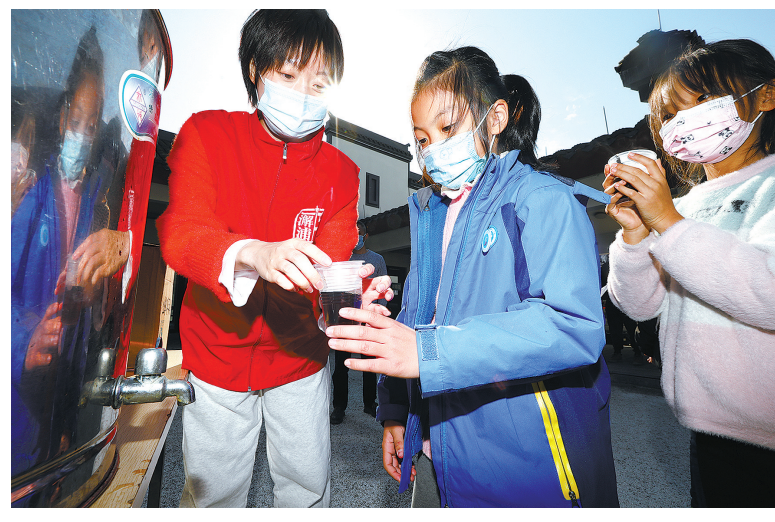
前天,镇海潮浦镇的潮小美志愿者团队和福宝宝志愿者团队来到辖区方舱临时接种点,为医务人员和接种群众送去红糖姜茶,驱寒送暖。