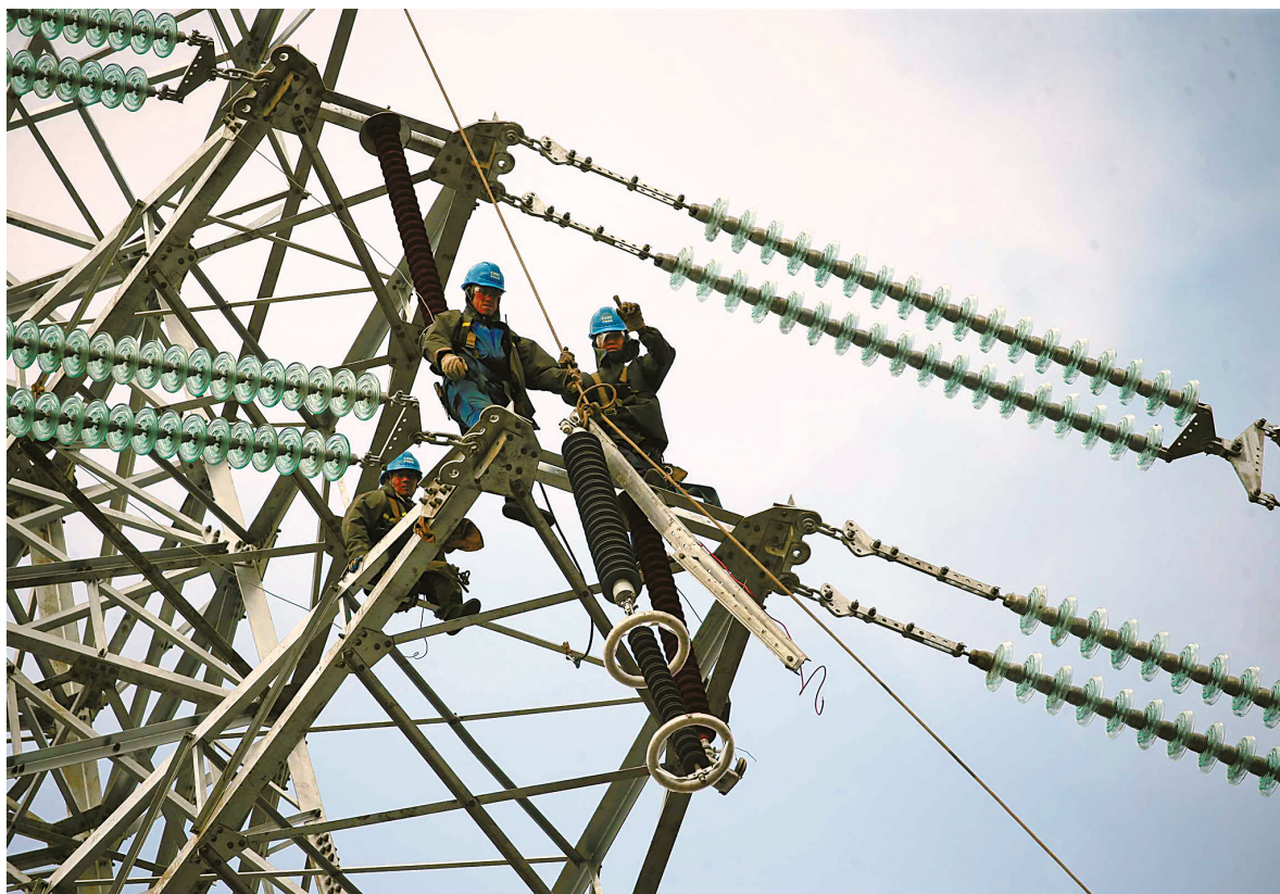
电力人员在塔上进行附件安装作业。

截至目前,金甬铁路跨越线路改迁工程已完成大半,浙江宁波供电公司和浙江火电公司全体施工成员将全力攻坚,力争在春节前完成剩余2条电力线路三跨改造。