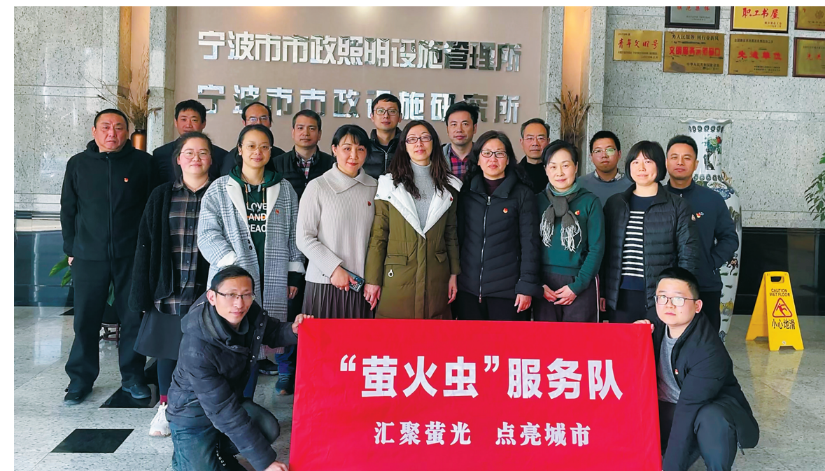
“萤火虫”志愿服务队全体成员合影。

时间投入保障工作，成为城市光明的“守灯人”。在今年“七一”灯光保障任务中，队员们在做好本职工作的同时，第一时间积极报名参加鄞州公园、三江口无人机拍摄保障任务，从晚上6点30至次日凌晨，大家全程参与，全力协助拍摄工作。看到自己努力的成果引起良好的社会反响，大家都由衷地感到自豪，也更加深刻地感受到自己责任深重。 服务队将志愿服务与自身工作有效结合，将日常学习教育成效转化为争先创优的强大动力，经常参与市政设施夜间巡查保障行动。大家边走边查，发现黑灯、设施破损、道路坑洞多、停车秩序混乱等问题，及时发送照片和定位至服务队微信群，联系养护单位人员尽快组织落实维修，保障设施正常运行。