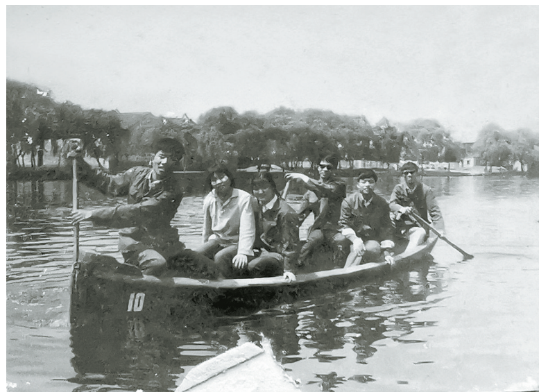
单位同事乘坐手划船游湖。

月湖不仅为周边居民提供生活用水,也提供饮用水,那个时候因为没有自来水,多数饮用的是天落水,但井水枯竭的时候,我和邻居就会去挑月湖的水,到家后用明矾浸一下,沉淀一下里面的杂质,就可以饮用了。月湖原本是没有公园的。在20世纪60年代初,尚书桥一带的房子被拆迁,建成一个规模不大的公园,称为月湖公园。1998年,市政府投资6亿元,对月湖东区进行大规模改造。随后的2年,又对月湖西区进行拆迁改造,不断提升景区文化、景观、设施的层次,依托天一阁的历史文脉,终于在2018年,获评国家5A级旅游景区的称号,很好地诠释了“一部宁波史,半部在月湖”的理念。画家吴冠中在一幅《双燕图》享