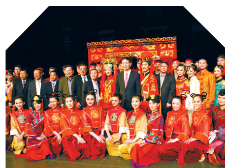
舞剧《十里红妆·女儿梦》赴美演出