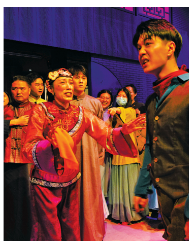
沉浸式演出《入戏·老外滩》

值得一提的是，作为“庆祝中国共产党成立100周年舞台艺术精品创作工程”重点扶持剧目，12月18日晚当代舞剧《洗星海》正式通过了“百年百部”舞台艺术精品创作工程的验收，评审专家们一致认为这是一部引领、突破、不落俗套的当代舞剧，颠覆了传统舞剧的表达方式，赋予了洗星海这个人物更加丰富的色彩，有深度、有内涵，激发了观众无限的艺术联想。这也是继民族歌剧《呦呦鹿鸣》、舞剧《天路》之后，宁波市演艺集团一年内第三部入选并顺利通过“百年百部”验收专家评审的剧目。