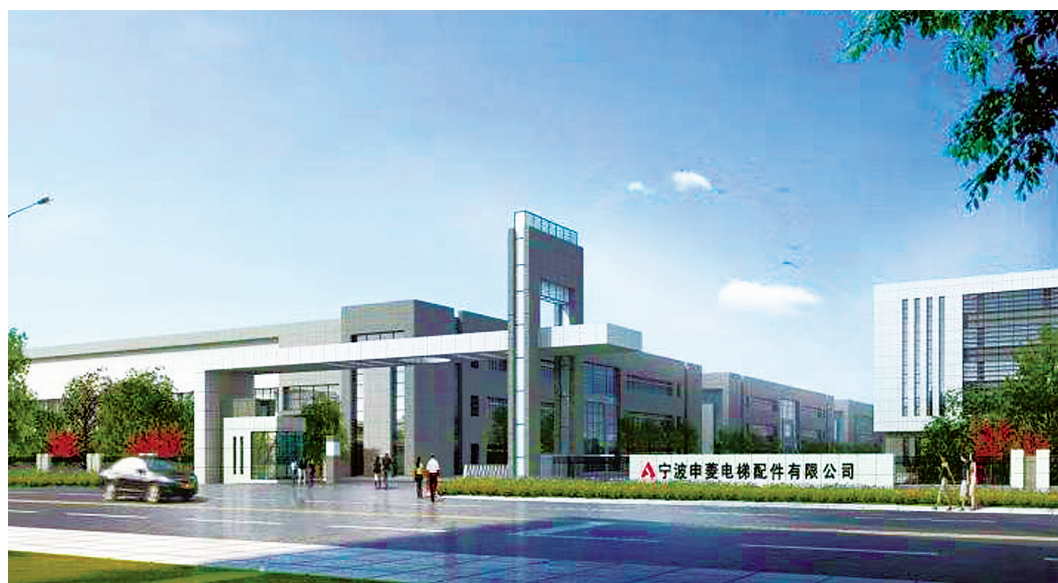
宁波申菱电梯有限公司。

如今，跨界融合的理念，使石浦旅游的发展方式由封闭自循环向“旅游+”融合发展方式转变，促成旅游由“门票经济”向“产业经济”转变、由“景点旅游”向“全域旅游”转变。