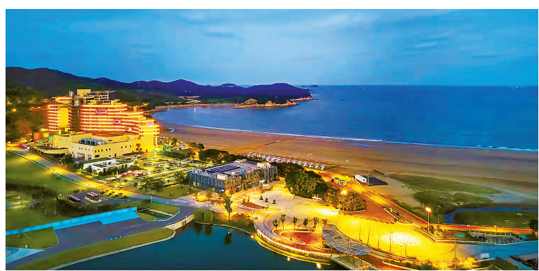
石浦半边山旅游度假区夜景。

风劲潮涌，自当乘风破浪；任重道远，更需策马扬鞭。石浦将以时不我待的干劲、久久为功的韧劲、不忘初心勇担当、牢记使命尽职责，凝心聚力、务实奋进，改革创新、追赶跨越，全力打造“海上两山”实践地。