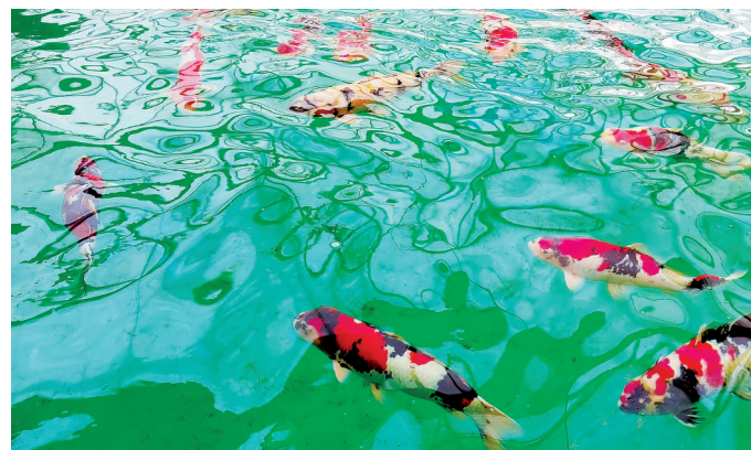
「郭斌锦鲤」畅游水中。

郭斌与锦鲤的结缘源于偶然。2002年他到广东潮州出差,被一家街边店里的锦鲤吸引住了。2003年,随着对锦鲤的兴趣日益浓厚,郭斌开启了养锦鲤的新事业,他每天起早贪黑蹲守养鱼场,做好精准