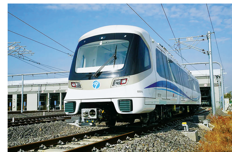
轨道交通5号线列车。

裘东耀首先来到民安东路站，详细了解轨道交通5号线一期的站点分布、场站装修特色和技术工艺创新、数字化智能探索应用等情况，感谢轨道交通建设者的辛勤付出。他指出，轨道交通不仅要精心建设好，更要用心管理好、运营好，提高老百姓乘坐的获得感、满意度。