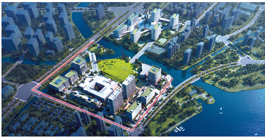
研究院设计效果图

作为赋能宁波高质量发展的又一重要引擎,诺丁汉大学卓越灯塔计划(宁波)创新研究院由宁波市人民政府与英国诺丁汉大学合作共建。今年5月,研究院正式在宁波国家高新区入驻启动。