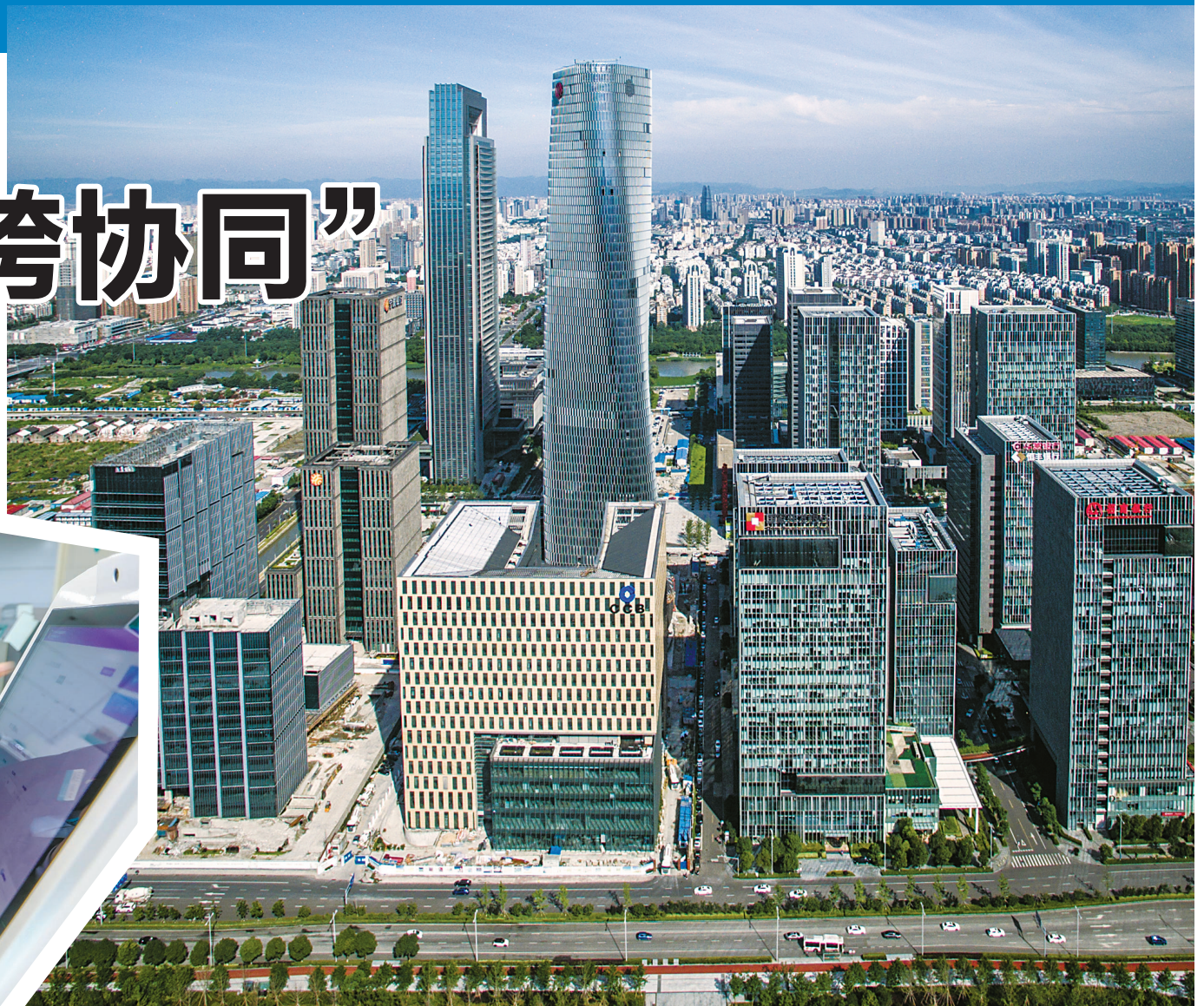
▲宁波国际金融中心。

上周五，全市金融工作会议指出，“十四五”末，宁波基本建成长三角地区辐射力强、影响力大的产业金融创新中心和区域性金融中心。