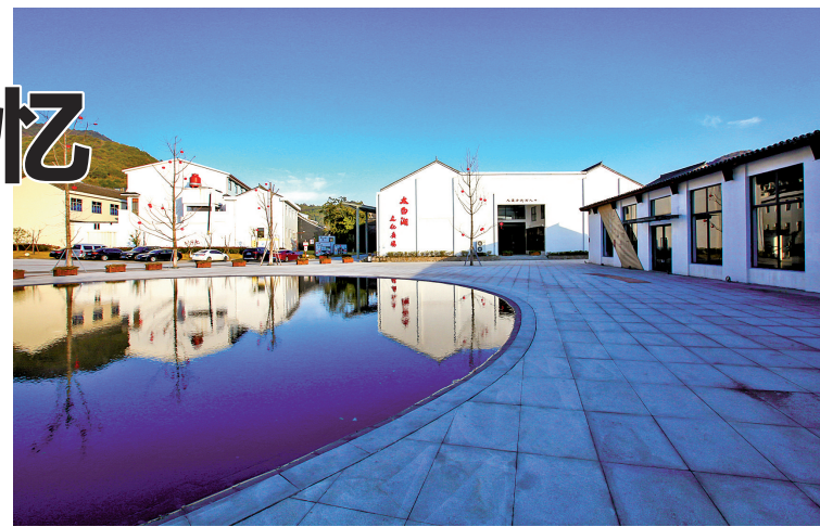
天童老街根据古建筑结构类型、建筑年代的不同进行了分类改造。

东窑陶艺馆、“松隐”非遗竹根雕生活馆、布与生活、海丝寻迹文化馆等30多家当地美食和文旅产业特色店铺。