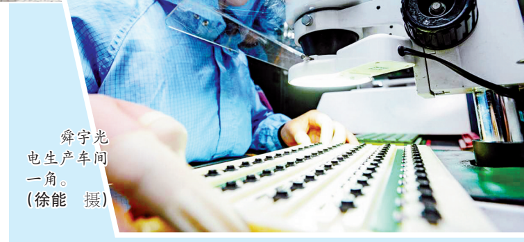
舜宇光电生产车间一角。