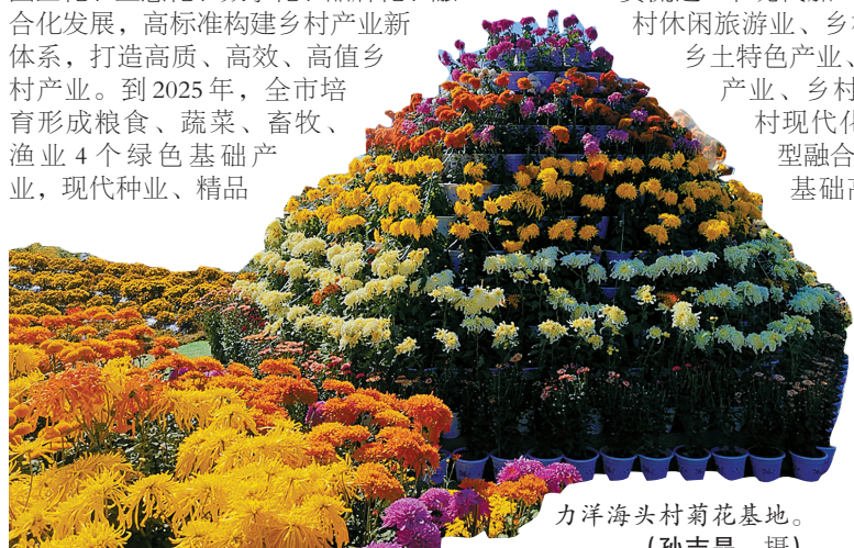
力洋海头村菊花基地。(孙吉晶 摄)