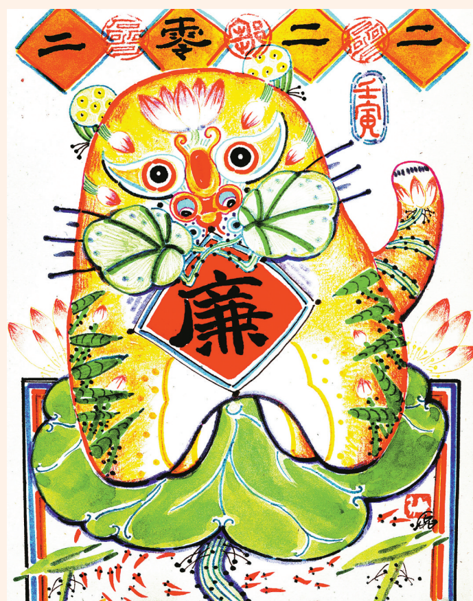
湖里有青莲，虎里有清廉