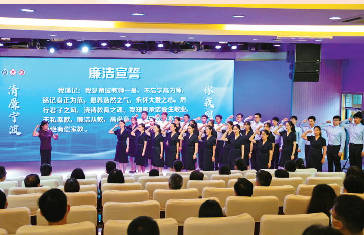
市纪委监委组织开展“清廉宁波·你我同行”系列活动，加快推进清廉单元建设。

2021年，全市纪检监察机关自觉践行“两个维护”，认真履职，担当尽责，充分发挥监督保障执行、促进完善发展作用，为“十四五”开好局起好步提供了坚强保障，全市全面从严治党成效度继续位居全省前列。