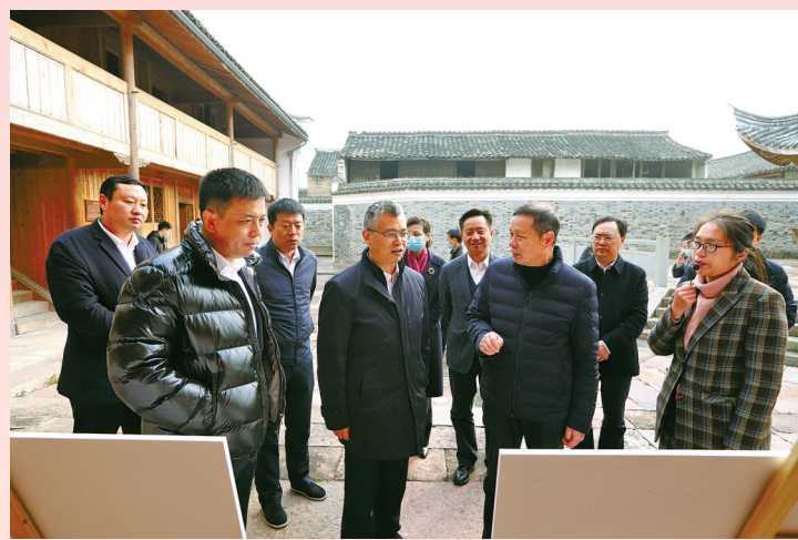
全市各级纪检监察机关通过加强乡镇（街道）纪检监察工作规范化建设，开展基层涉纪信访专项治理等工作，有力推动清廉村居建设。图为市委常委、纪委书记、监委代主任叶怀贯赴奉化区江口街道王淑浦村调研指导。