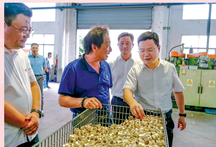
全市各级纪检监察机关立足自身职能，持续精准监督护航优化营商环境，推动构建亲清政商关系。图为时任市委常委、纪委书记、监委主任傅祖民赴民营企业调研指导。

聚焦村庄撤并、农村基层“三资”管理、被征地人员参保、农村乱占地耕地建房等领域，我市纪检监察机关加大查处力度。去年共查处问题354起，其中党纪政务处分266人。