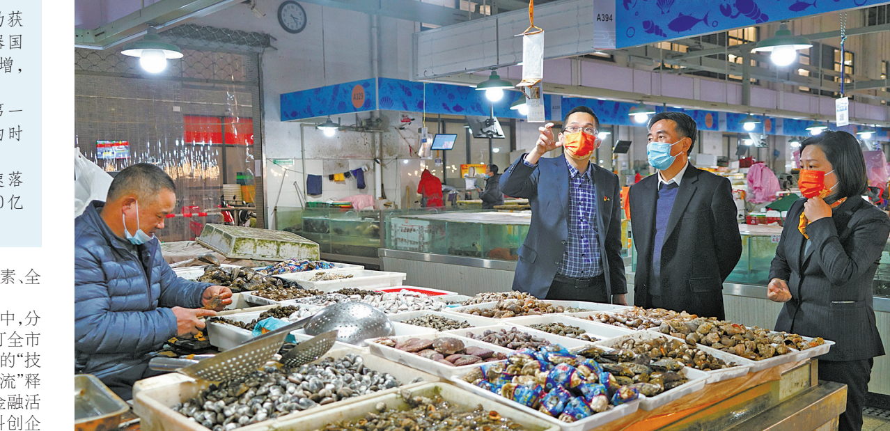
分行负责人带头深入一线，调查企业经营情况。

以推动经济高质量发展为出发点，深耕客户服务，全面提升制造业客户经营能力。分行锁定制造业单项冠军、“龙头”企业、“专精特新”小巨人企业和高新技术企业特定客群，积极对接我市十大产业链，选取优质“腰部”企业，补充完善制造业名单库；开展制造业金融服务攻坚行动，移植、创新“发展贷”，运用供应链产品、超级雷达、业务推进管理系统等金融工具，持续提升制造业信贷客户的经