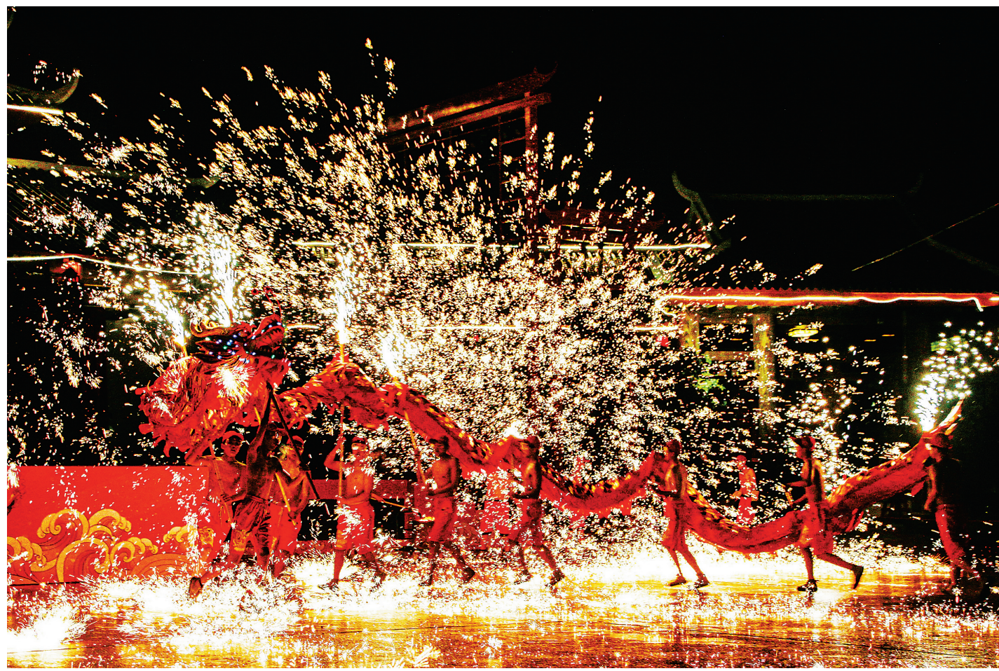
▲春节假期，方特东方神画、方特东方欲晓双园项目全开。非遗绝技“火龙钢花”首次亮相，将“龙”与“火”完美结合，为游客带来一场视觉盛宴。