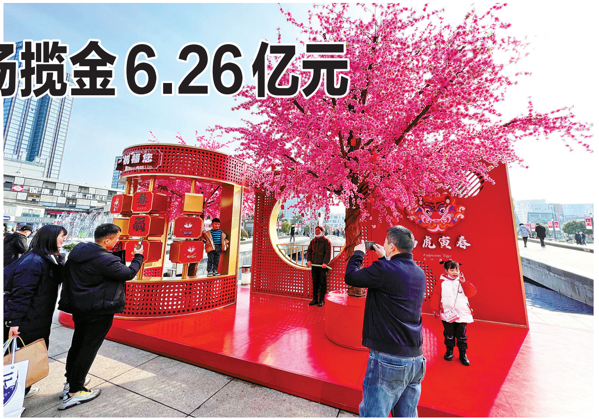
春节假期首日，天一广场张灯结彩，人头攒动，热闹非凡，市民置身其中享受假期美好时光。

今年1月，疫情的发生让宁波餐饮行业和电影市场一度陷入萧条的阴霾。春节假期，年夜饭、团圆饭、亲朋宴热闹涌动，优质春节档影片强势来袭，在市民的支持下，这对“难兄难弟”终于开始恢复元