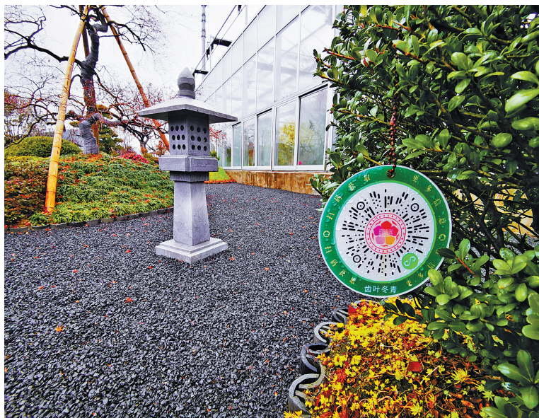
待售花木挂有“数字身份证”。

通过农旅融合，将原本粗放式经营的花木产业向精品苗木、庭院经济转型。“我们想借助‘数字门牌’‘一键游金峨’小程序等数字化手段，激发乡村生态旅游，提升人气，走出花木村新的发展之路。”村党支部书记周康健表示。春节假期，尽管天气不佳，