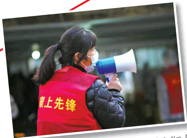
大碇街道自制“小喇叭工作法”。1000个小喇叭每天早上6点在各微网格准时响起，网格员走街串巷喊话，动员群众按时定点完成核酸检测采样。