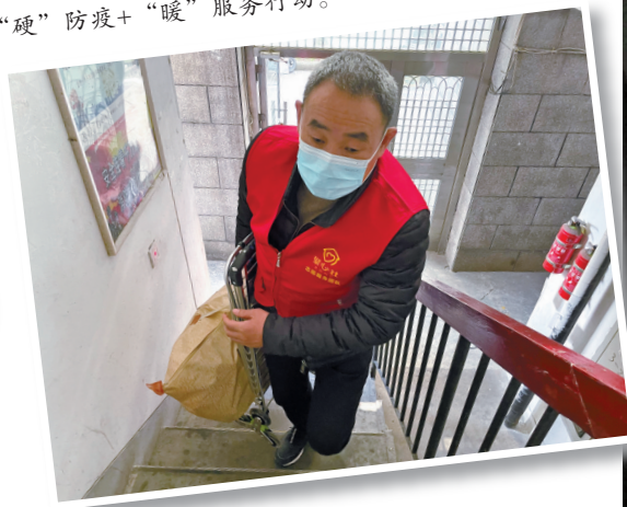
网格长贝九良为群众运送相关物资，推动“硬”防疫+“暖”服务行动。