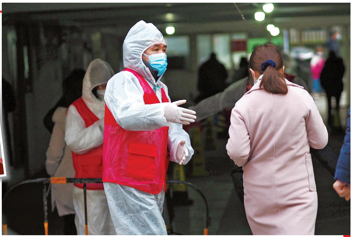
微网格工作人员在核酸采集现场做好人员分流工作。