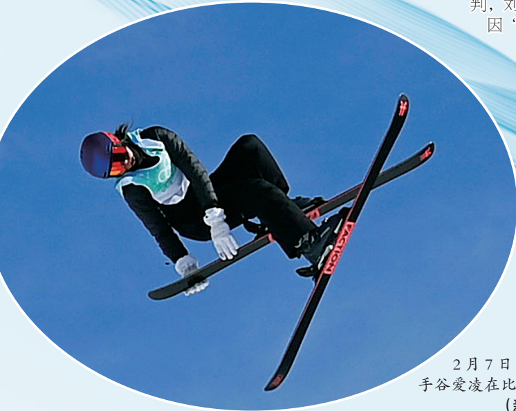
2月7日，中国选手谷爱凌在比赛中。