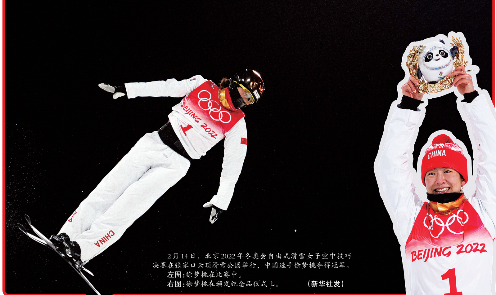
2月14日，北京2022年冬奥会自由式滑雪女子空中技巧决赛在张家口云顶滑雪公园举行，中国选手徐梦桃夺得冠军。