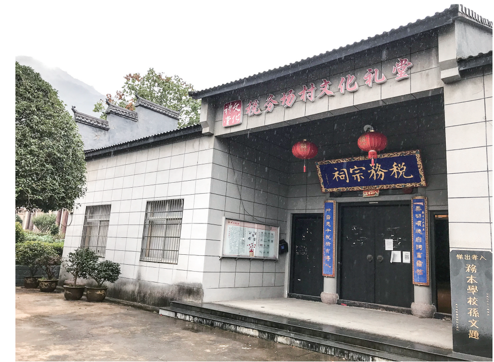
税务场村修葺一新的文化礼堂大门边，立着孙中山先生题写的《务本学校校文题》一石碑。