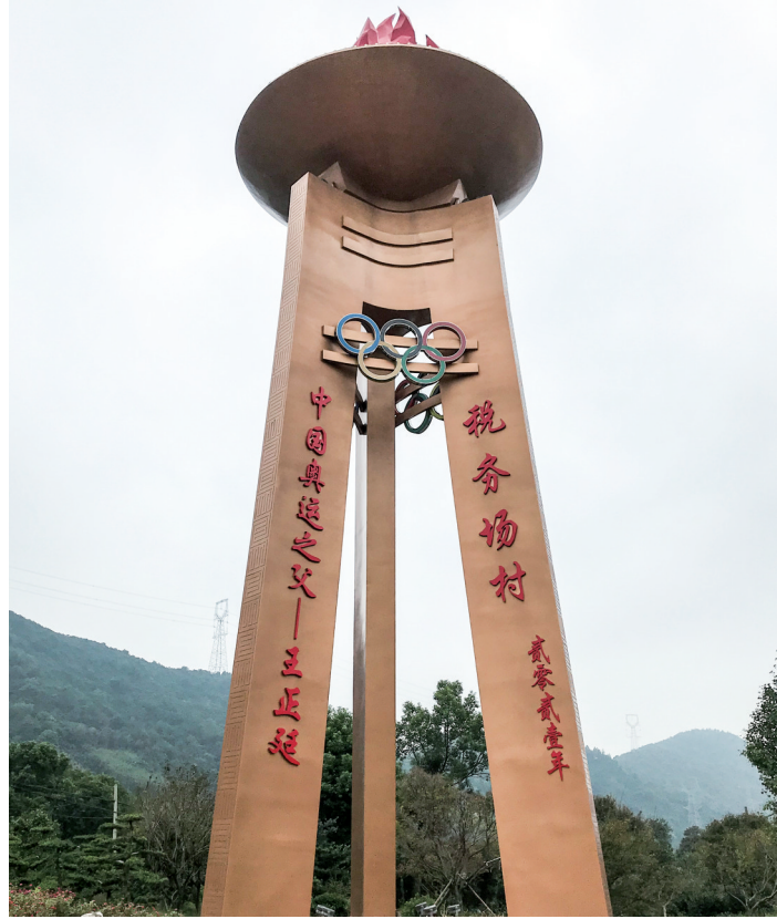
2021年7月，税务场村村口立起高18.82米的奥运火炬塔。