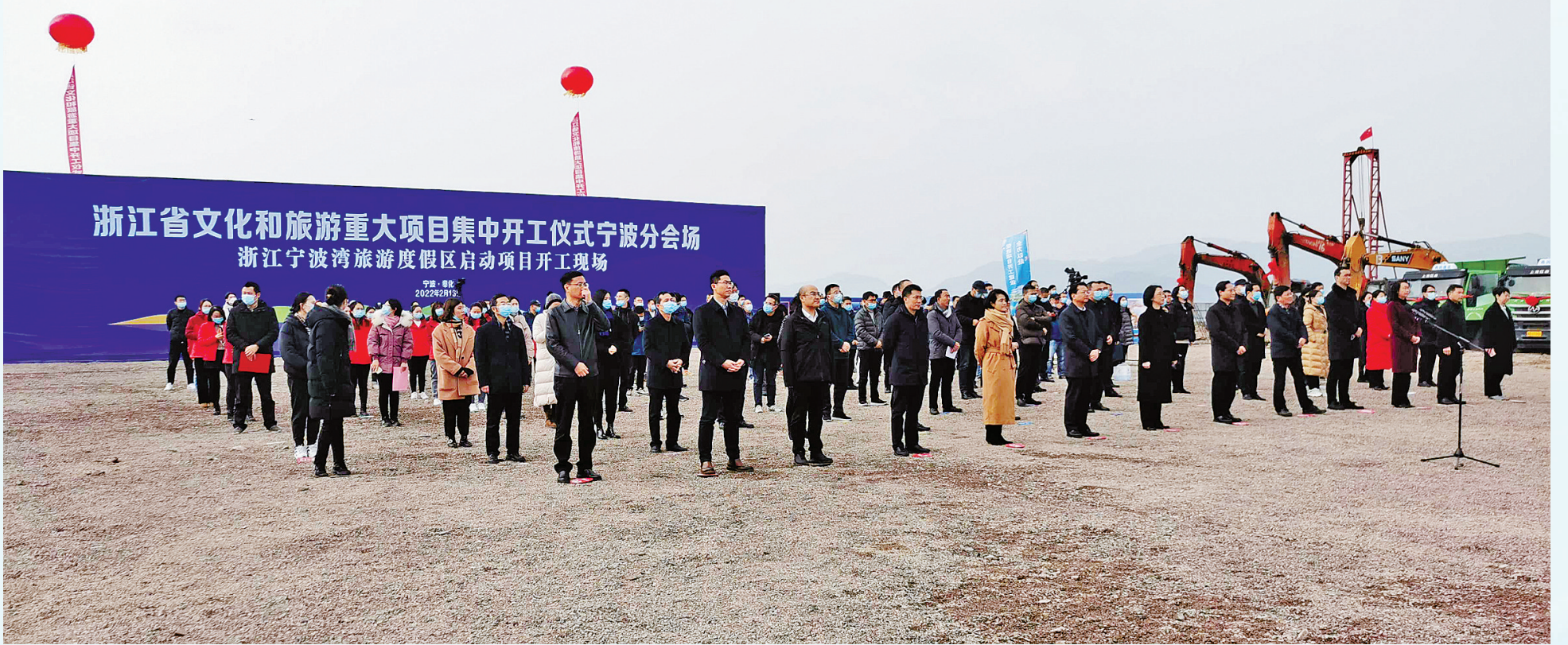
2022年宁波重大文旅项目集中开工现场。