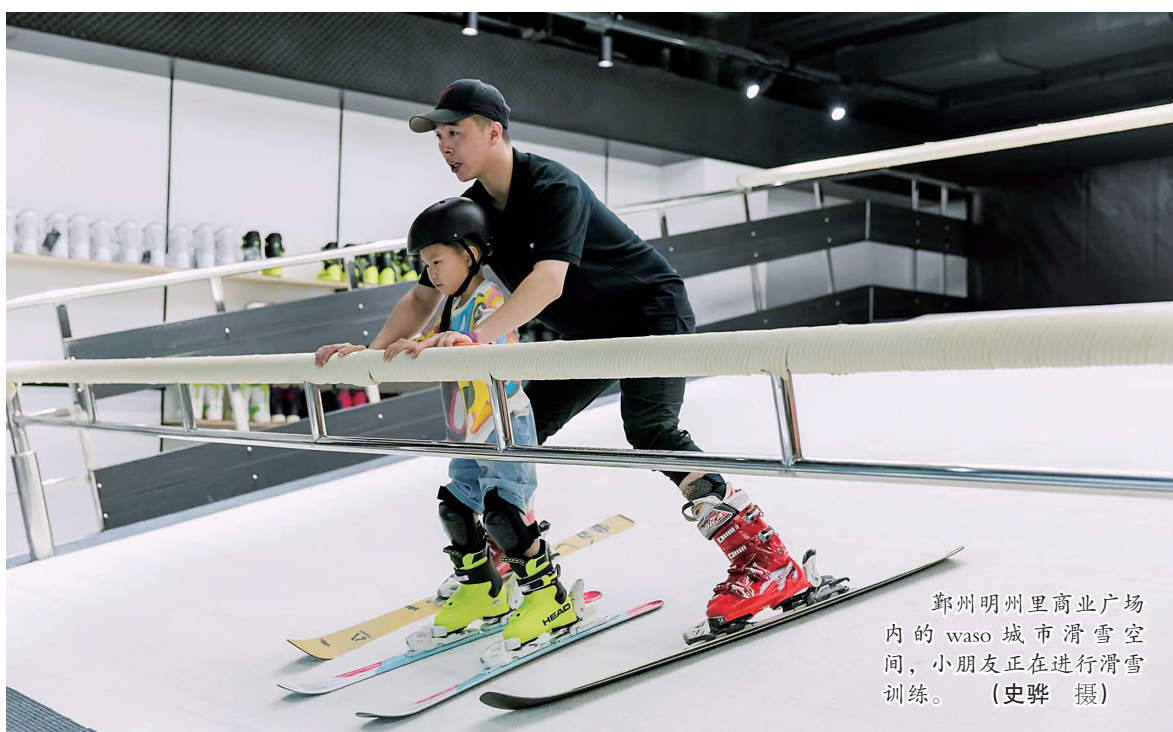
鄞州明州里商业广场内的waso城市滑雪空间，小朋友正在进行滑雪训练。

作做最大努力，虽然最终没有亮相赛场，但他们的付出，不容忽视。没有宁波运动员参加在家门口举办的冬奥会，不免有些遗憾，也说明宁波竞技体育，在布局上尚待完善。除了传统的夏季奥运会项目，宁波也需要在冬季运动项目上有所突破，为国家“三亿人上冰雪”作出贡献。