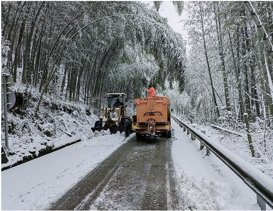
“公路橙”正在除雪保畅通。

同一时间,海曙区公路与运输管理中心的巡查车已出现在四明山区公路上,身着橙色标志服的巡查抢险人员成了第一批“看