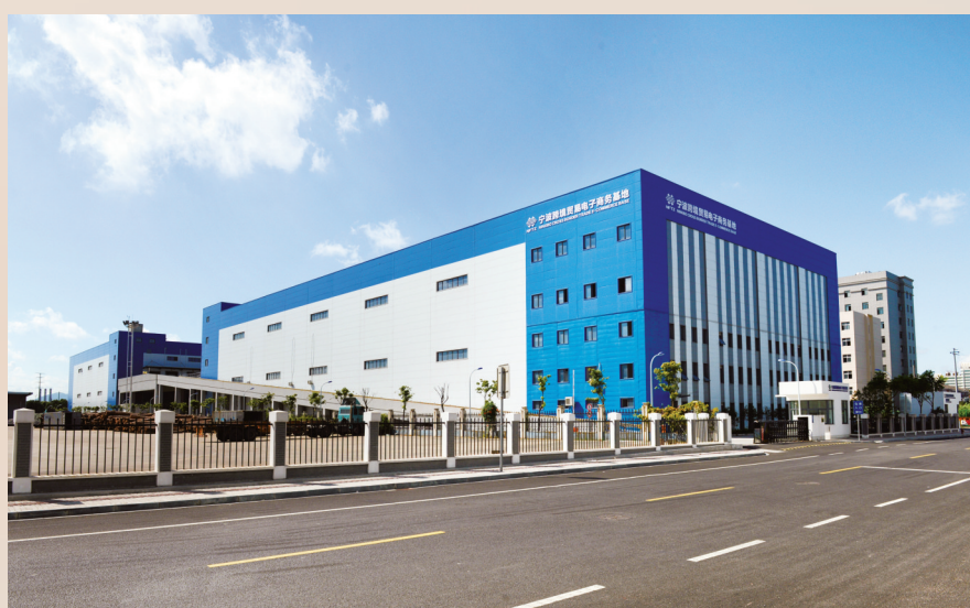
宁波跨境贸易电子商务基地