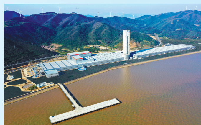
东方电缆东部（北仑）基地·数字化未来工厂