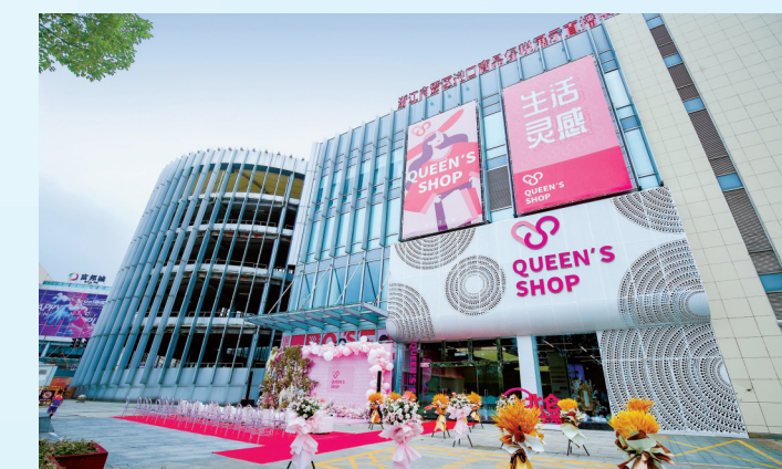
浙江自贸试验区宁波片区进口商品保税展示直播中心

提高公共安全保障能力。北仑不断提高安全生产管理水平，完善隐患排查、评估、预警、防控机制，持续加强对危化品、消防、建设工程、道路交通、“两小企业”等重点领域专项治理，推动青峙、霞浦、大榭等化工园区综合整治。