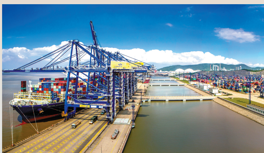
大榭招商国际集装箱码头