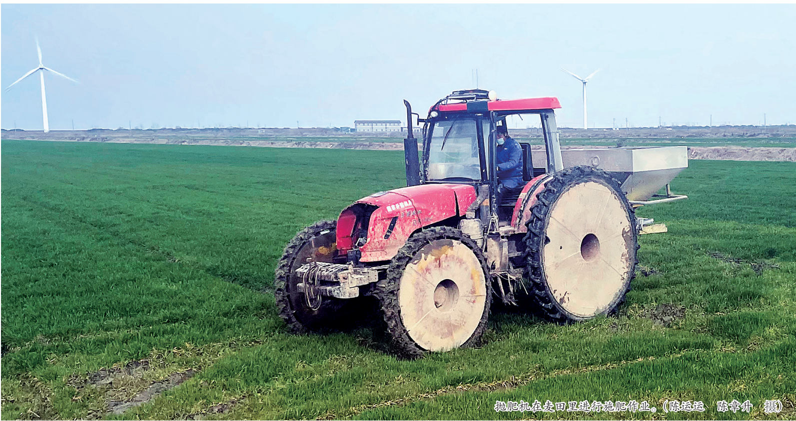
抛肥机在麦田里进行施肥作业。

本报讯（记者陈章升 通讯员陈运运 李郑颖）昨日上午，在慈溪市现代农业开发区，正大农业园区员工驾驶抛肥机在麦田里进行施肥作业。其间，肥料从机器里四散抛射，均匀地落在地里。“驾驶1台抛肥机完成60亩麦田施肥只需20分钟。”正大桑田（宁波）农业发展有限公司生产经理胡迪均说，