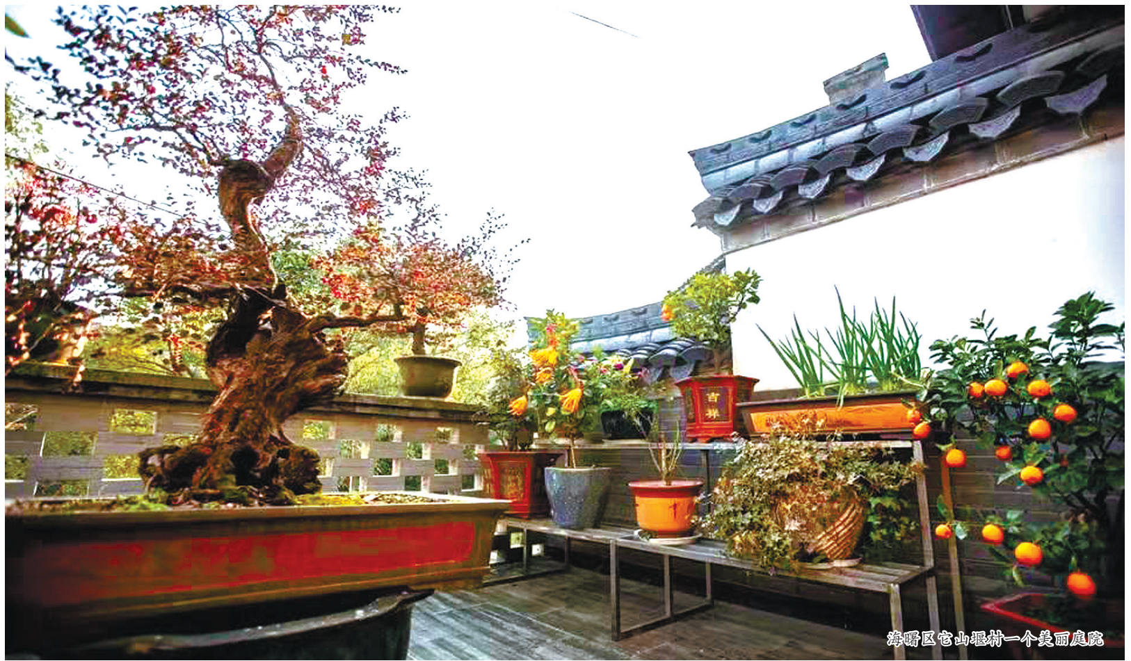
海曙区它山堰村一个美丽庭院