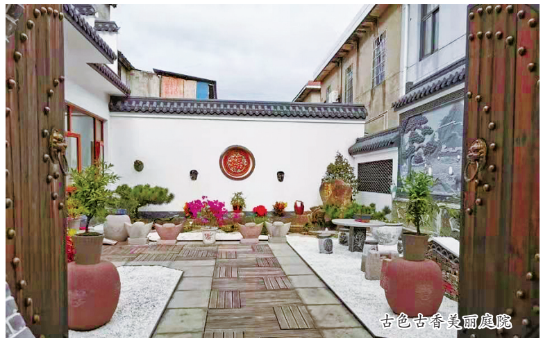
古色古香美丽庭院

农村局联合出台的《宁波市高水平创建美丽庭院三年行动计划（2020—2022年）》，明确“3366”工作目标，即到2022年底，全市美丽庭院创建累计达到30万户，寻找300户市级最美庭院，培育认定60条美丽庭院创建特色带、60个美丽庭院创建示范村。