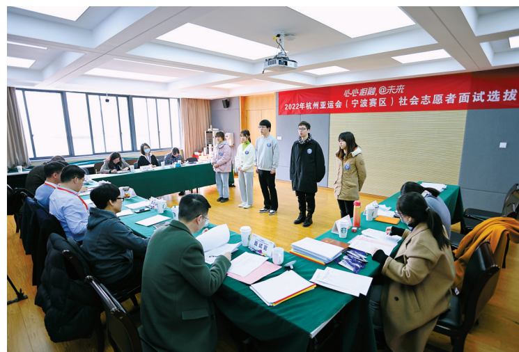
亚运会志愿者面试

据悉，报名者需要通过初步选拔、初始培训、线上测试、面试选拔、心理测试、英语应用能力测试、资格审查、承诺书签订、配岗排班等流程，才能正式录用为赛会志愿者。“目的是挑选优秀的人才进入志愿者队伍，为赛事提供优质的志愿服务。”相关工作人员说。