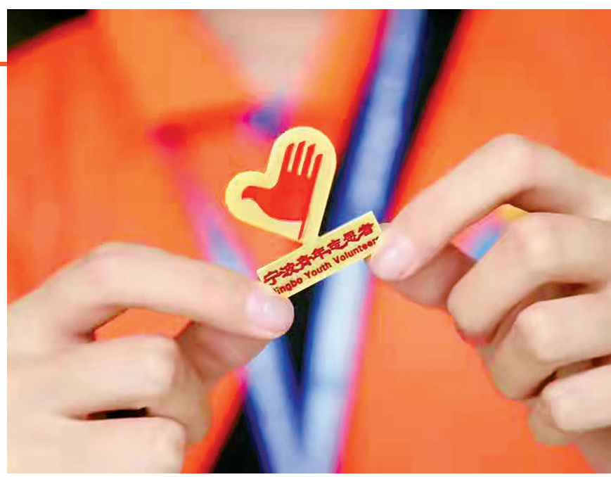
宁波青年志愿者会徽

“小星辰”“小湾仔”“小蟹蟹”“小青帆”……随着宁波城市对外开放和国际化水平的不断提升，大型赛会活动日益增多，越来越多的青年志愿者出现在大型赛会活动中，留下了青春有爱的身影。