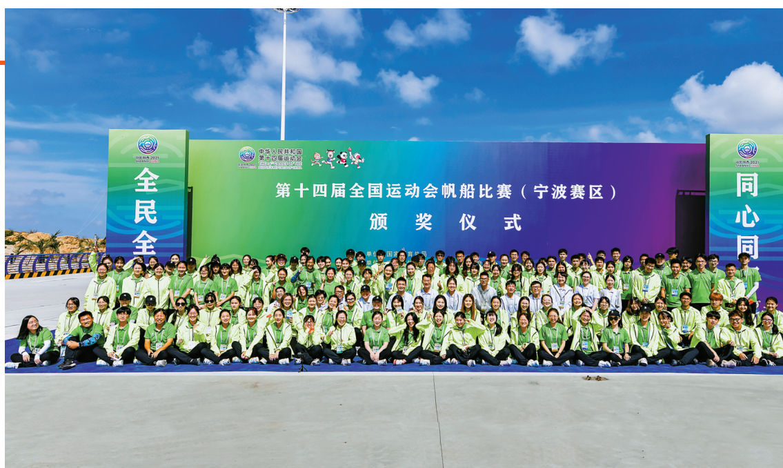
2021年9月，第十四届全运会帆船比赛全体“小青帆”志愿者合影