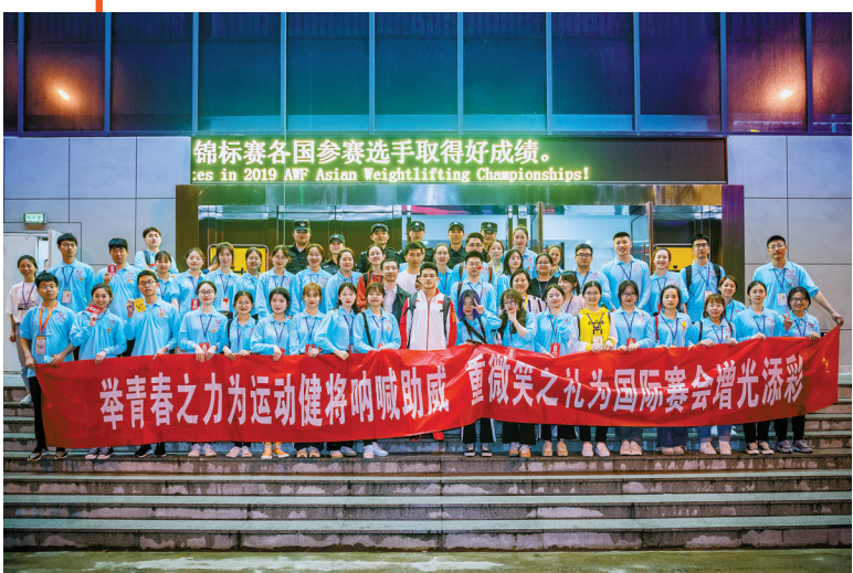
2019年亚洲举重锦标赛上，全体志愿者与冠军石智勇合影留念