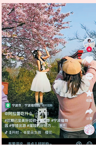
一主播在宁波植物园的草地里架上凳子,拉扯着樱花拍照。