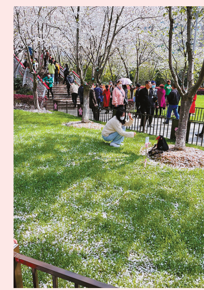
樱花公园内,一名“网红”跨入草地直播。