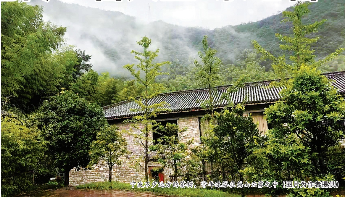
宁波不少地方的茶村，常年弥漫在高山云雾之中。

宁波是我国最早的原始茶产地之一。文献记载，西汉时四明山中就有大茗。唐时，陆羽著《茶经》，则提到了余姚的瀑布仙茗和鄞县榆荚茶。 得益于优越的栽种环境和悠久的栽种历史，宁波境内一直茶业发达，茶类品种丰富，城乡各地遗存着大量与茶相关的地名。