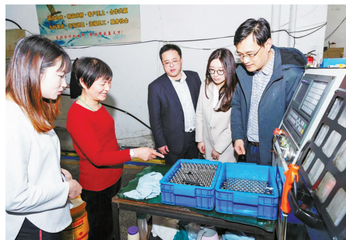
工行宁波市分行普惠金融部信贷人员正在对接企业金融需求。

建设。工行宁波市分行还通过运用物联网、区块链、人工智能等技术，积极服务乡村传统产业升级。 (沈颖俊)