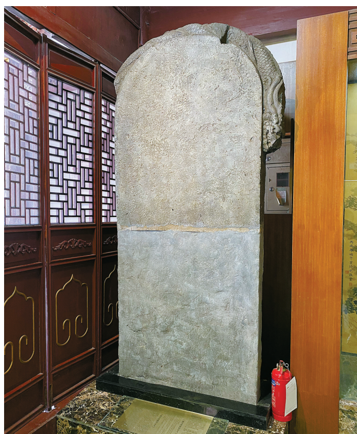
镇明路上的高丽使馆内，留有楼钥篆刻文字的石碑

是士大夫家族、社团聚会中的音乐宴饮，随处可见轻歌曼舞，显示了明州人丰富的音乐文化生活。