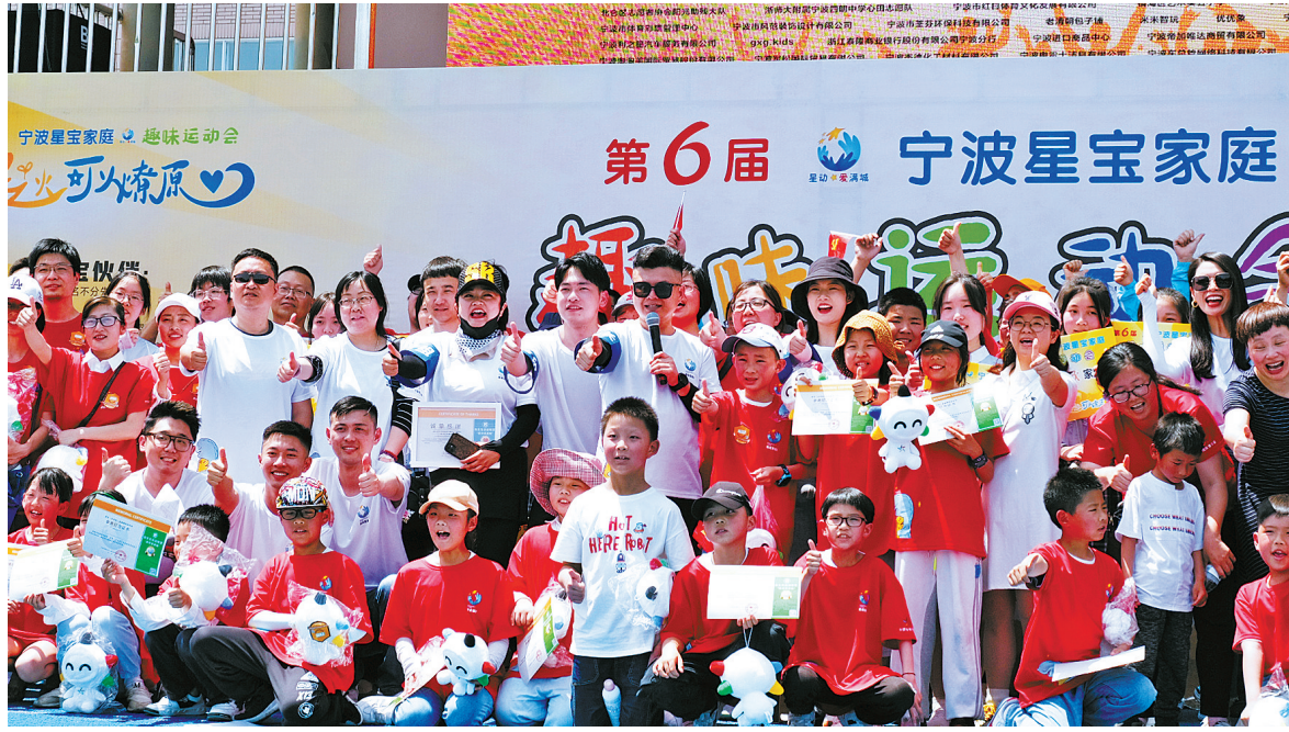
宁波“星宝”家庭趣味运动会。