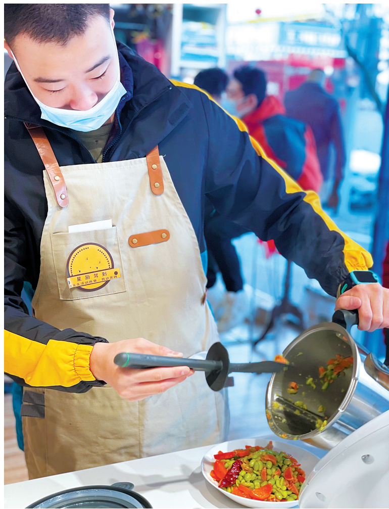
在“心厨当家”，孤独症青年使用智能料理机烧菜。