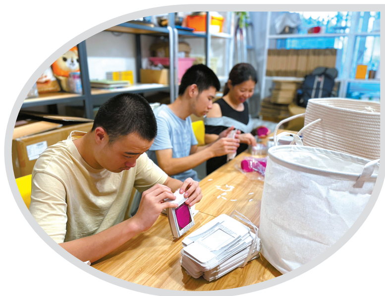
家长陪同孤独症孩子在“星宝工坊”做手工活。