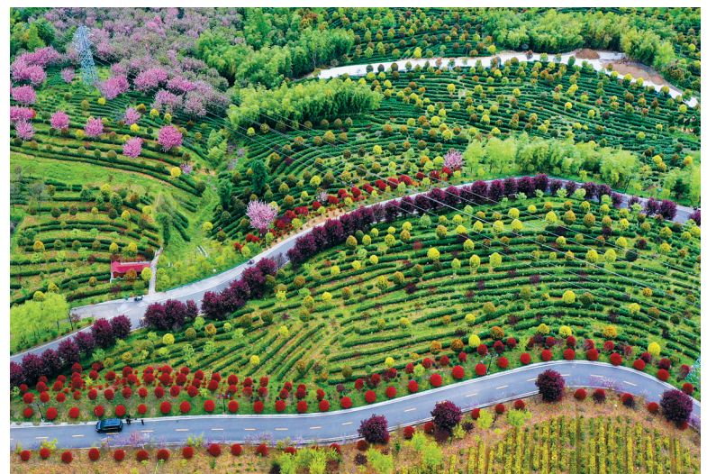
4月4日拍摄的平利县长安镇的茶园（无人机照片）。

秦巴山区的陕西省安康市平利县是传统的茶业产区。近年来，当地立足资源禀赋，按照“政府引导、市场主导、农户参与、共建共享”的思路，走“龙头企业+合作社+农户”的模式，为茶产业高质量发展提供政策和资金支持。目前，全县茶园总规模已20余万亩，茶产业从业人员近10万人，基本实现“人均一亩园、户均一万元”的目标。